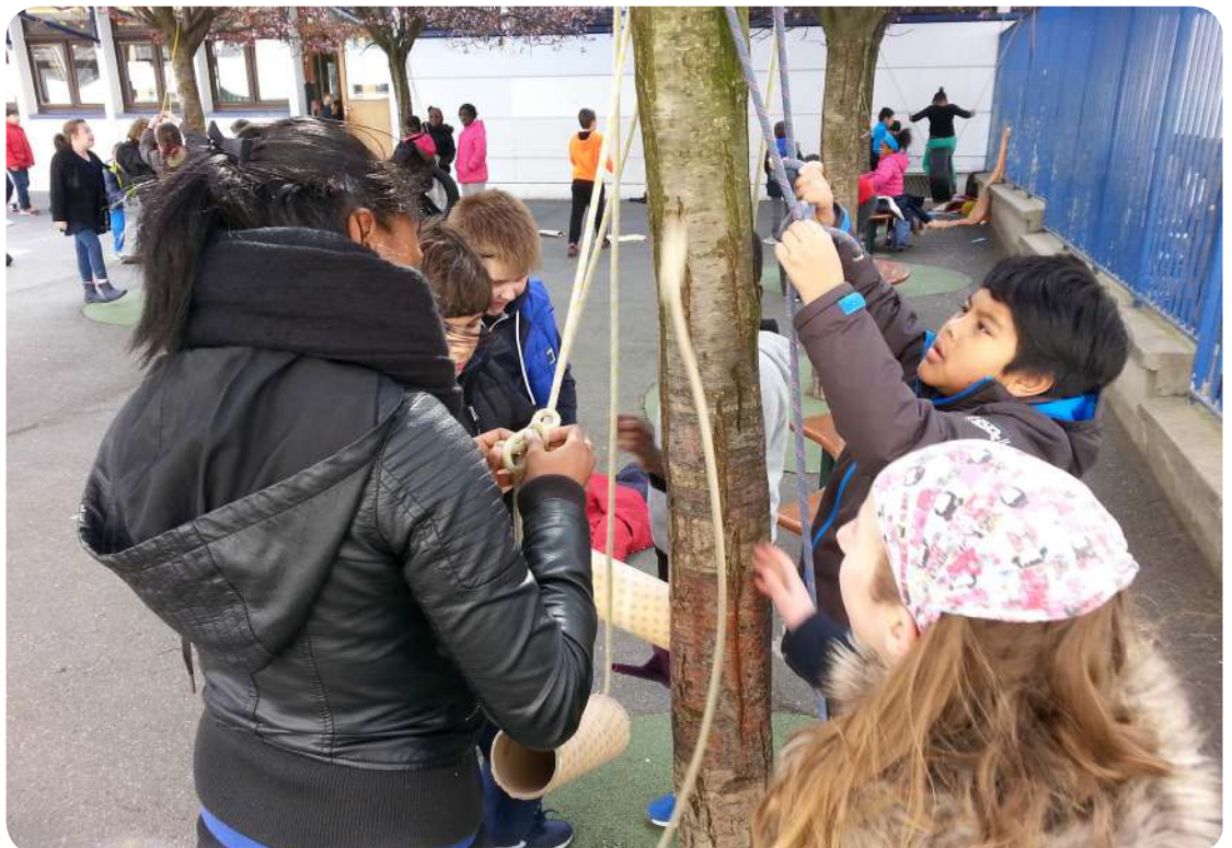
Boîte à Jouer à l'école Wurtz 2016

Le déballage des ressources ludiques est en accès libre.