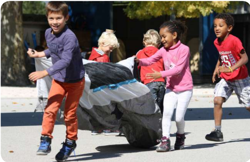
La Boîte à Jouer de l'école Chabestan à Die, dans la Drôme Projet pilote 2015

Un minimum de 25 minutes est requis pour permettre le jeu, et la gestion du déballage et du rangement des objets.