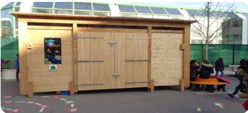
La Boîte à Jouer de l'école Reims Paris 17 - 2019

Puis la Boîte est fabriquée et une date d'installation est décidée : ça y est, elle est montée dans la cour !