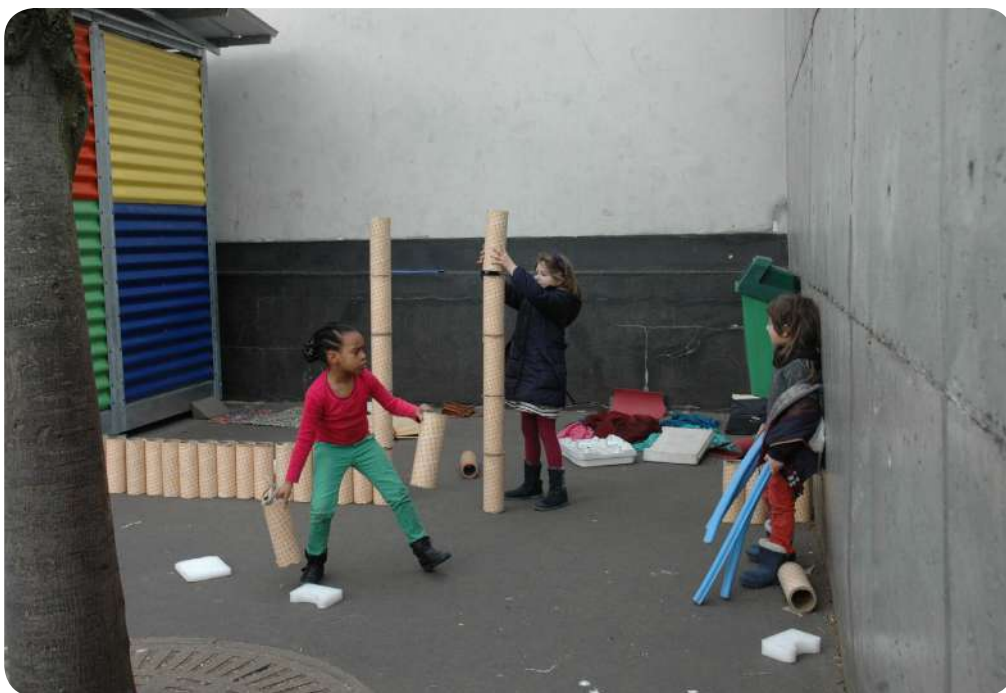
Jouer à l'école Vitruve Paris 20 – projet pilote – 2015

L'adulte est vigilant à la sécurité de l'enfant et intervient en suivant le protocole d'évaluation des bénéfices du risque, transmis en formation.