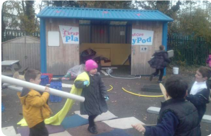
Scrapstore Playpod - Bristol - voyage d'étude - 2013

La taille et l'emplacement de la Boîte sont importants. Ils ont été proposés par l'association suite à un diagnostic du terrain de jeu, puis discutés avec la structure éducative et les différents partenaires et usager.es de la cour.