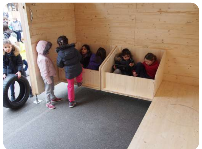
Exemple de bacs de rangement

Il y a une procédure pour le rangement, où chaque encadrant.e a un rôle précis. Cela permet de fluidifier le processus et de le rendre rapide, efficace, ludique.