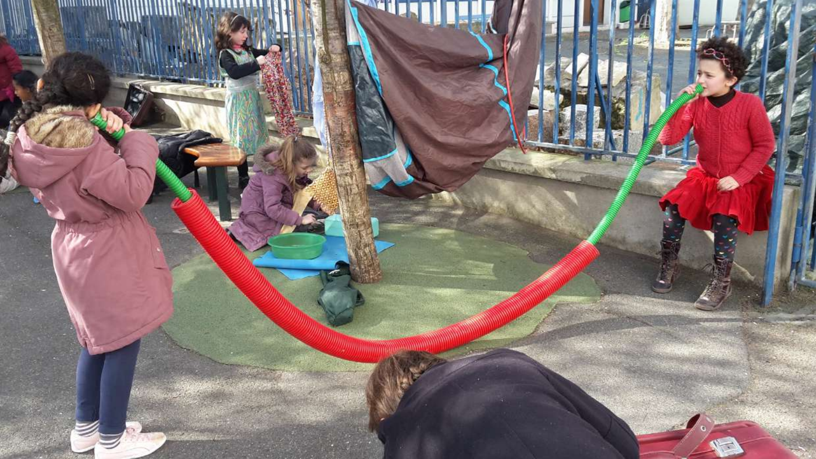
La Boîte à Jouer à l'école Wurtz - 2016