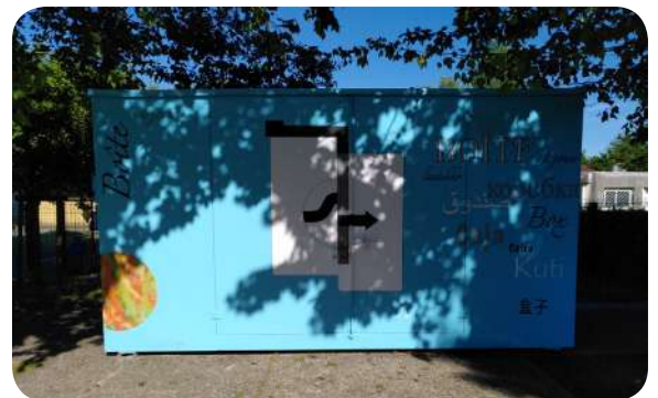
La Boîte à Jouer de l'école Peyrouat Mont de Marsan - 2024

Le premier jour d'ouverture est un grand jour, c'est l'euphorie dans la cour !