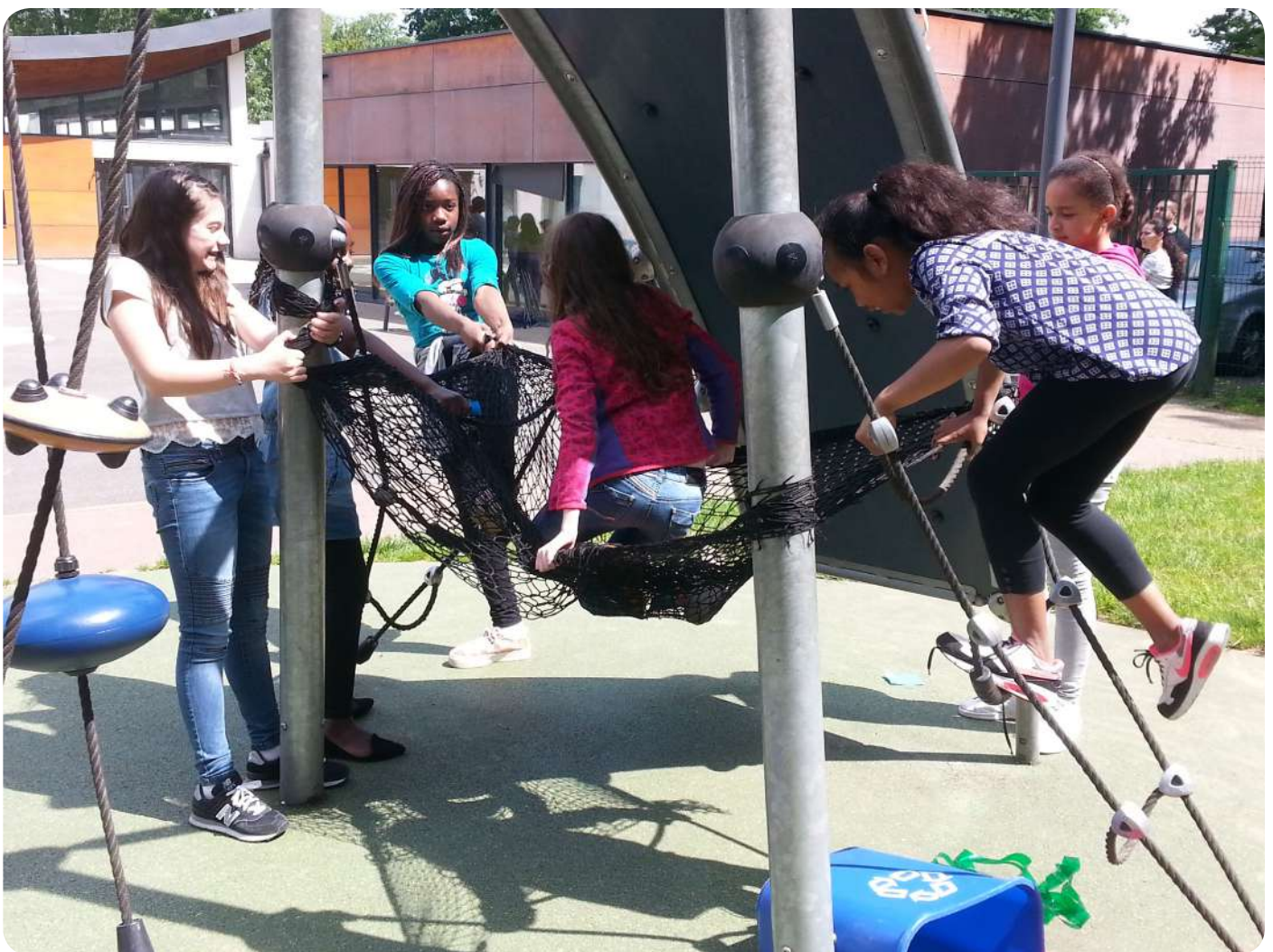
La Boîte à Jouer du Centre aéré du Parc – France - 2016

D'autres changements peuvent survenir aussi, comme l'organisation de la pause déjeuner qui s'adapte aux fonctionnements et au jeu avec la Boîte à Jouer.